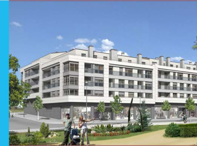
ALBELDA-01.2-2007 2007.08.28 / I