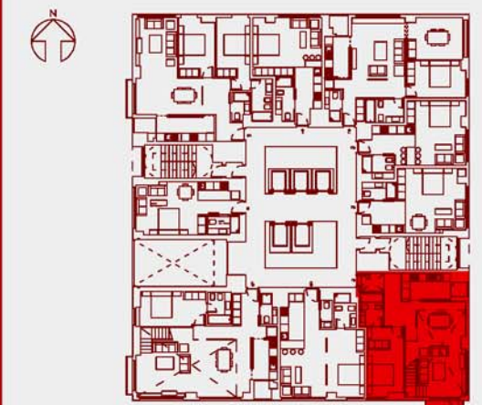
SITUACIÓN EN EL CONJUNTO