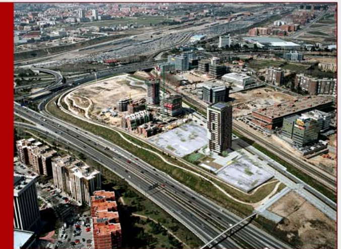
MADRID/MANOTERAS-05.2-2006 2007.09.26 / I